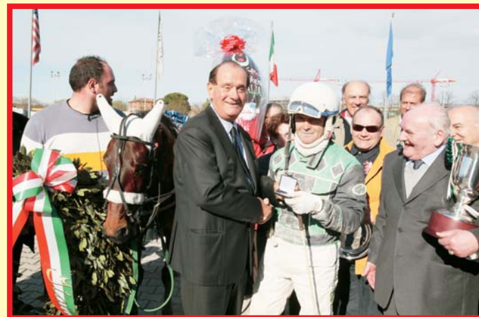
La Premiazione del Gran Premio Italia 2010.

Hippo Group Roma Torino Varese Cesena Bologna Arcoveggio