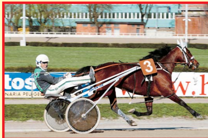
Nakitast vince il Gran Premio Italia 2010.