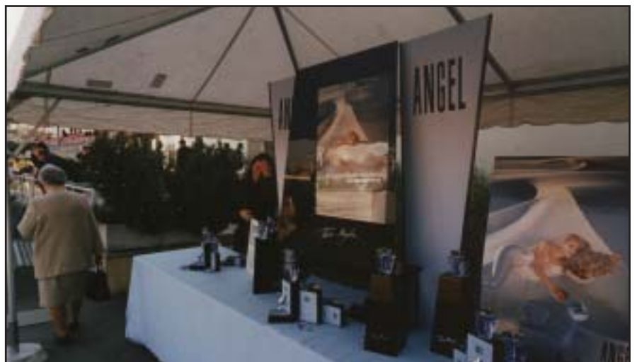
FOTO STAND ZONA TRIBUNE