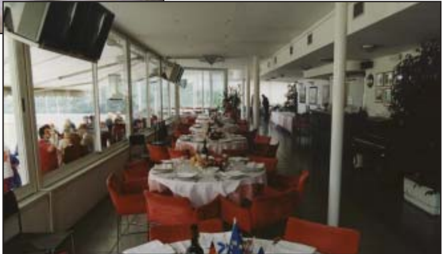
FOTO INTERNA DELLA CLUB HOUSE