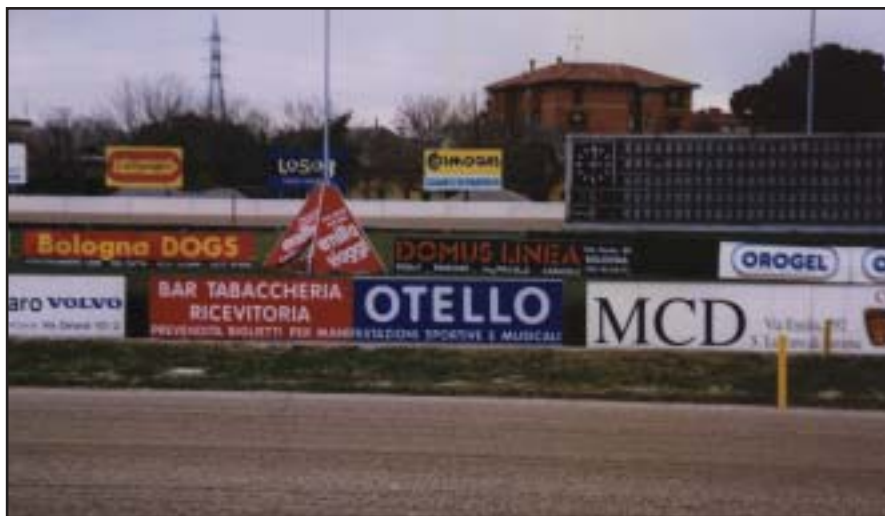
FOTO DI CARTELLONI PUBBLICITARI SUL RETTILINEO TRIBUNE