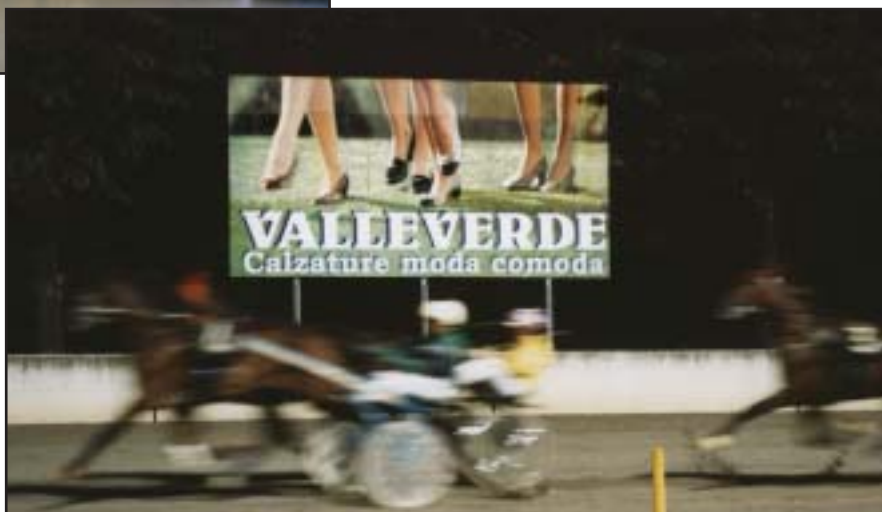
FOTO DEI MAXI POSTER PUBBLICITARI SUL RETTILINEO SCUDERIE