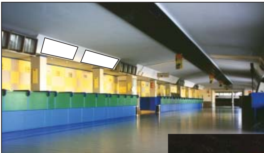
FOTO DEI PANNELLI PUBBLICITARI GALLERIA TOTALIZZATORI