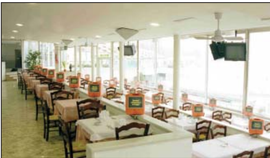
FOTO DEL RISTORANTE FRONTE RETTILINEO