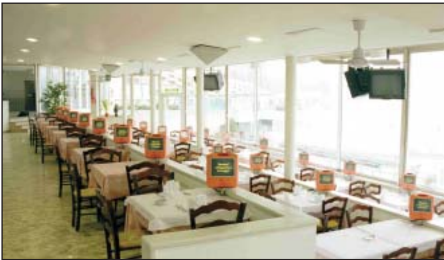
FOTO DEL RISTORANTE FRONTE RETTILINEO