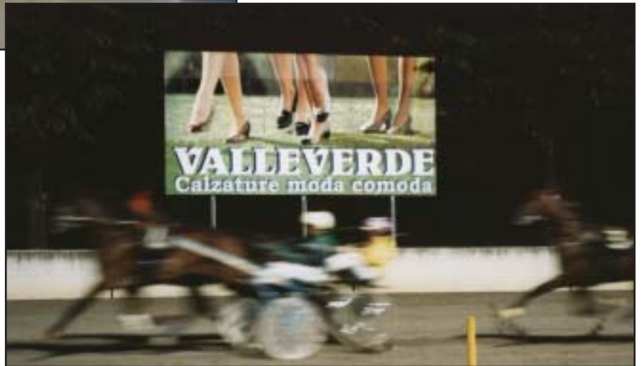
FOTO DEI MAXI POSTER PUBBLICITARI SUL RETTILINEO SCUDERIE