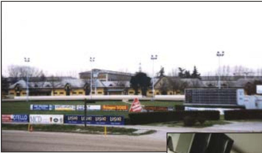
PANORAMICA DELLE TRIBUNE DAL RISTORANTE