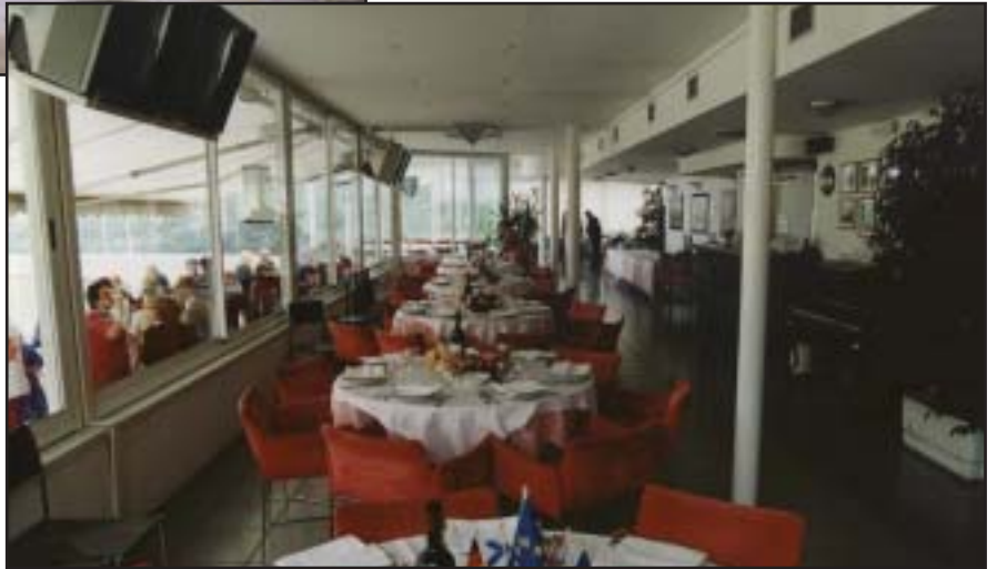
FOTO INTERNA DELLA CLUB HOUSE