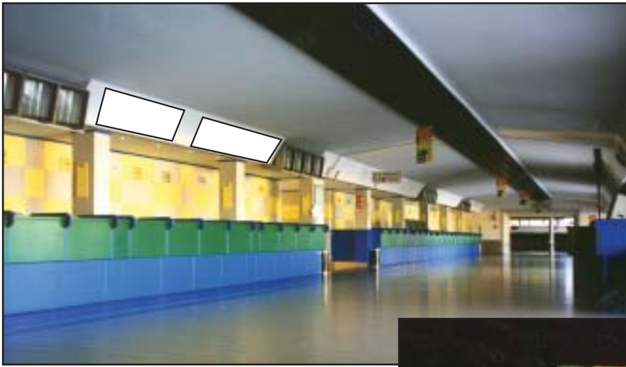
FOTO DEI PANNELLI PUBBLICITARI GALLERIA TOTALIZZATORI