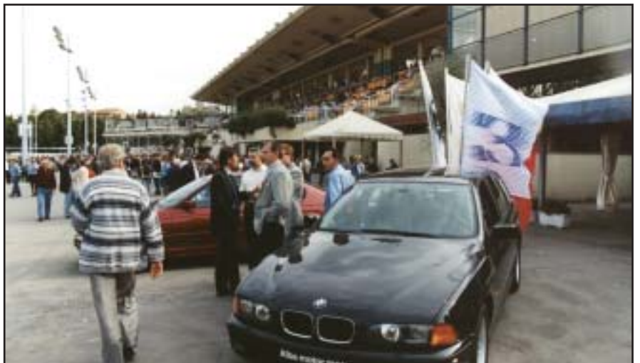
ESPOSIZIONE SUL RETTILINEO TRIBUNE