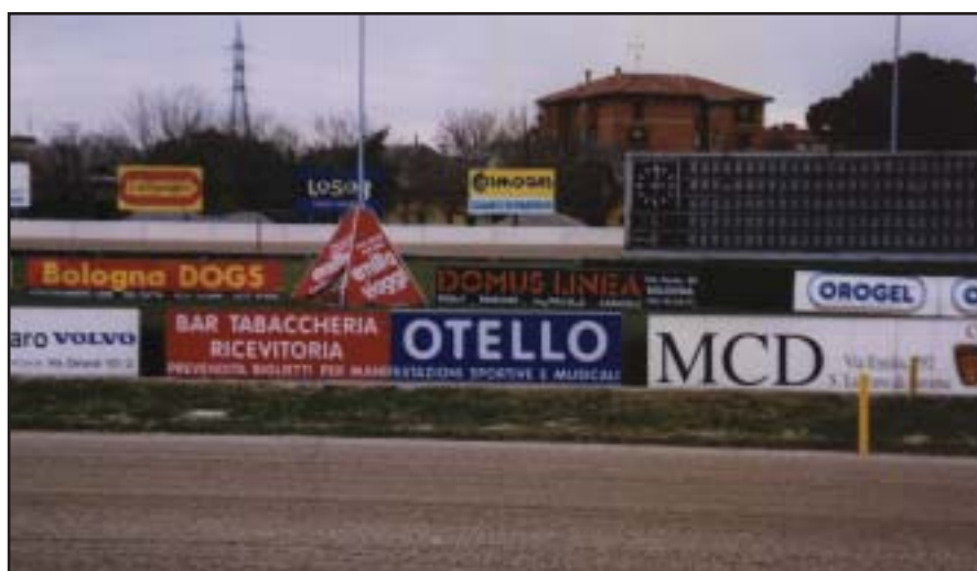
FOTO DI CARTELLONI PUBBLICITARI SUL RETTILINEO TRIBUNE