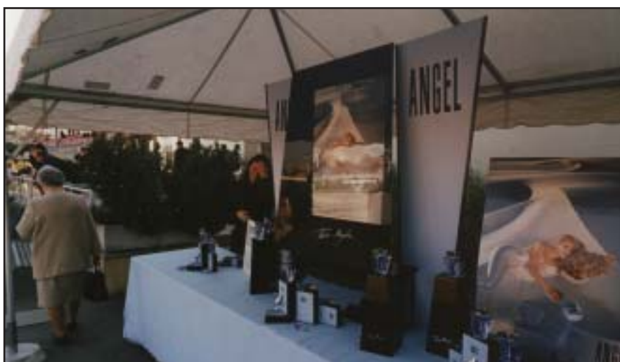
FOTO STAND ZONA TRIBUNE